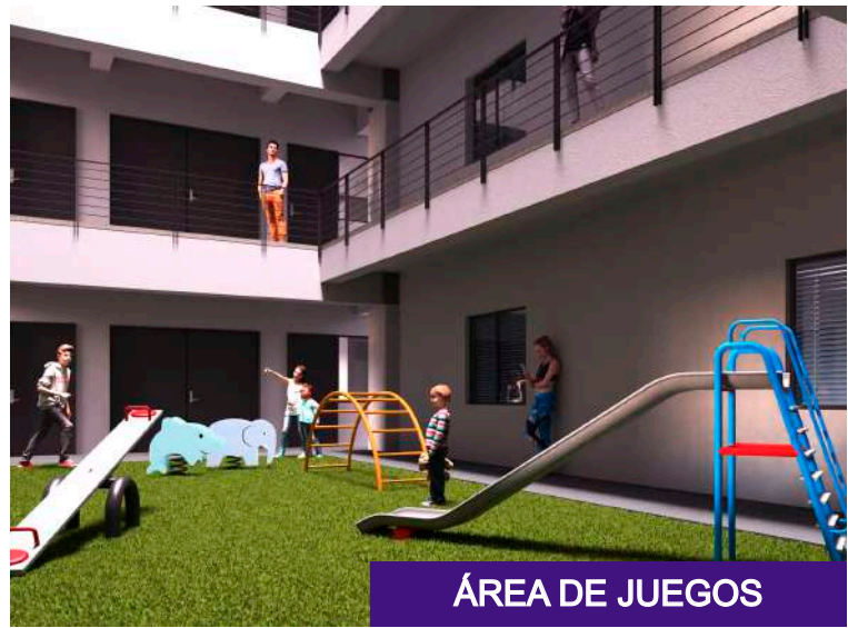
ÁREA DE JUEGOS