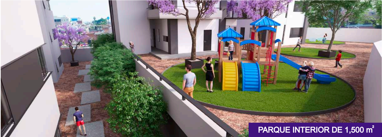
PARQUE INTERIOR DE 1,500 m 2