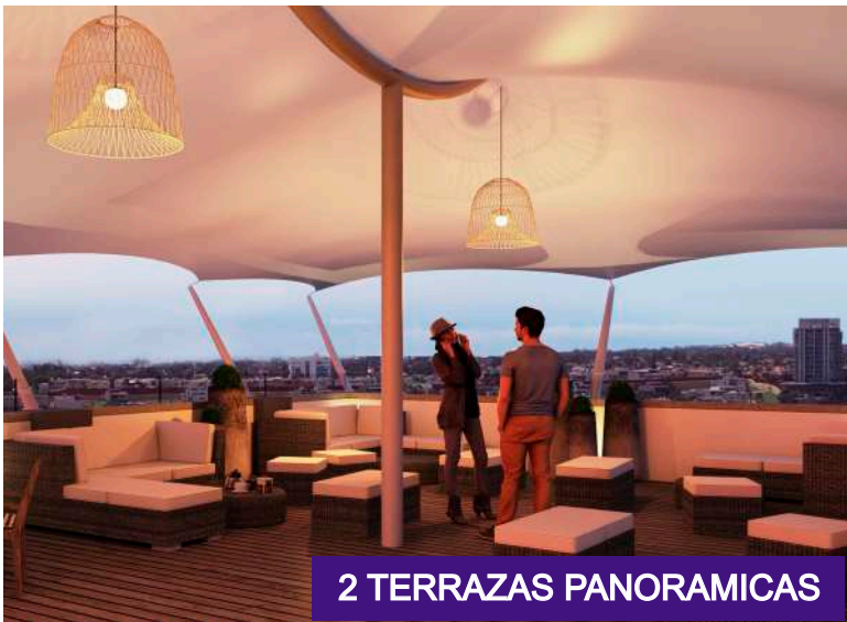
2 TERRAZAS PANORAMICAS